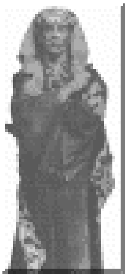
Bild 2: Aleister Crowley als Osiris bei einem Ritual des Golden Dawn in London

Im Mai geht er nach Mexico und besteigt dort zwei Berge mit Eckenstein.