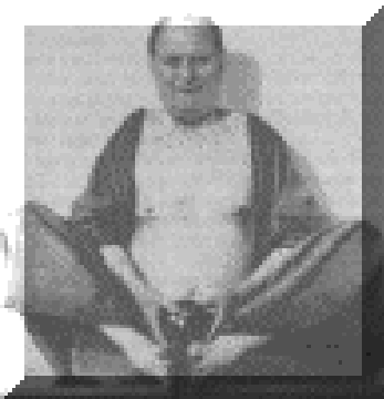
Bild 1: Ein charakteristisches Bild des Crowley der späteren Jahre. Hier posiert er als "chinesischer Gott Fo Hi" – der Gott der Freude und des Lachens...

Crowley hatte ein sehr wechselhaftes Leben. Nichts konnte ihn lange zufrieden stellen. Er wechselte ständig Aufenthaltsorte, Namen, Positionen und Rollen – je nach dem, welche Laune er gerade hatte und was sein niedriges Ego gerade wieder erreichen wollte. Er kokettierte mit verschiedensten Inkarnationen, trug immer andere Kostüme und Phantasienamen, log und betrog seine Mitmenschen zu jeder Gelegenheit, war Heroin- und Kokainsüchtig und nahm Frauen auf oder ließ sie fallen, wie und wann es ihm gerade gefiel. Sein Es tat, was sein „ES“ wollte und das Leben Crowleys zählt daher sicher zu den unrühmlichsten Biographien der Geschichte.