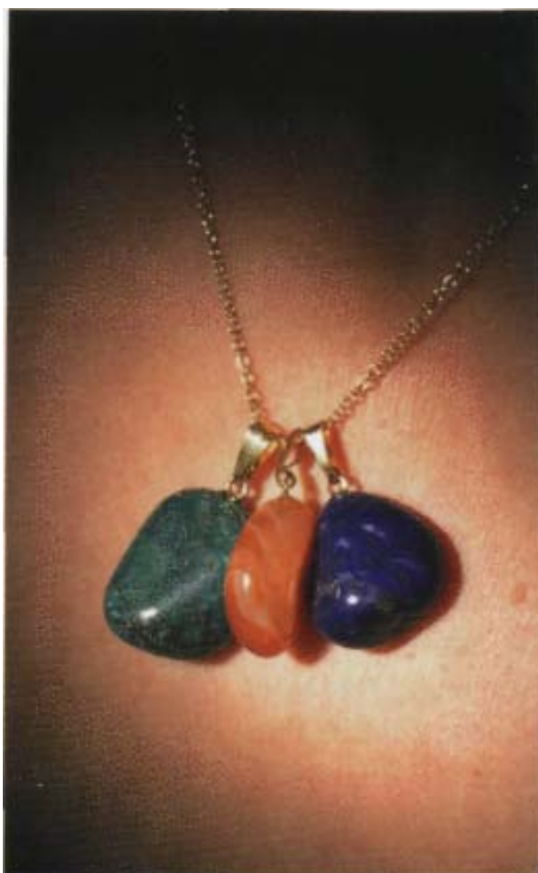
Steine können an einer Kette getragen werden

Hildegard von Bingen empfiehlt zum Beispiel beim Onyx, den Stein über dampfenden Wein zu halten. Dazu legt man am besten einen Handstein auf eine Gabel und hält beides über den Wein. Der Dampf