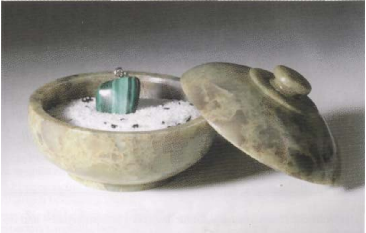
Aufladen der Steine in Energie-Mixtur

selber in Abständen neue Energie aufnehmen und speichern. Das ermöglichen wir ihnen dadurch, dass wir sie etwa alle sechs Wochen einen Tag lang in das Sonnen- oder Tageslicht legen.