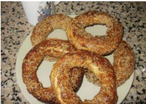
Türk. Sesamkringel - Simit