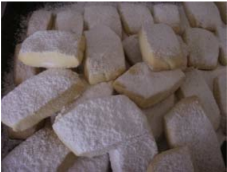
Türk. Mehlkekse - Un kurabiyesi