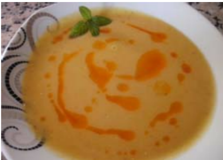
Rote Linsen Suppe - Mercimek Çorbası

Tipp: Frische Kräuter lassen sich hervorragend einfrieren.