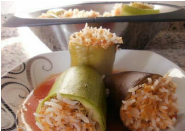
Gefülltes Gemüse mit Hackfleisch - Etlidolması