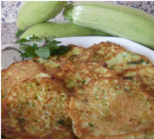
Zucchinipuffer - Mücver