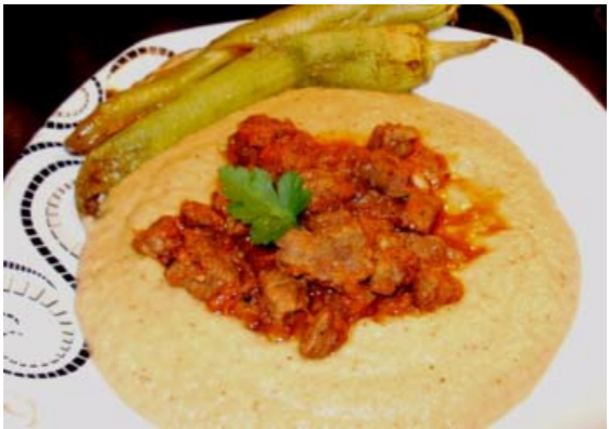
Auberginenpüree mit Ragout - Hünkar beğendi