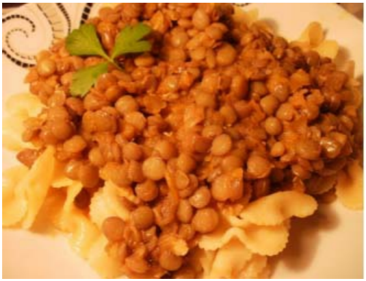
Grüne Linsen - Yeşil mercimek yemeđi