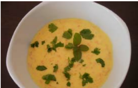
Möhrenmus - Havuç ezmesi