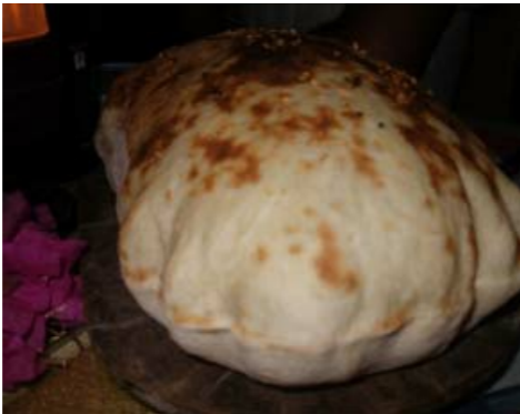
Ballon-Fladenbrot - Lavaş