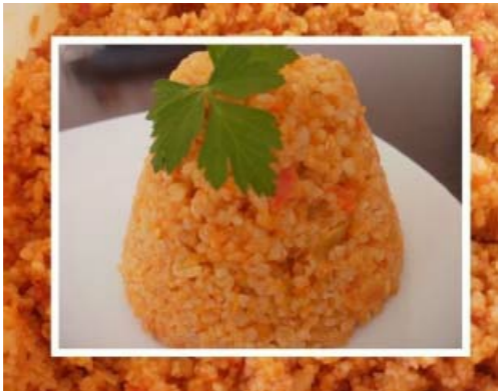
Tomaten Bulgur - Bulgur Pilavi