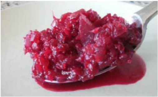
Rote Beete Salat