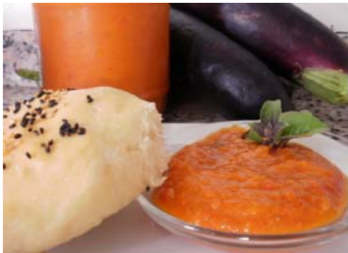
Ajvar mit Olivenöl-Brötchen