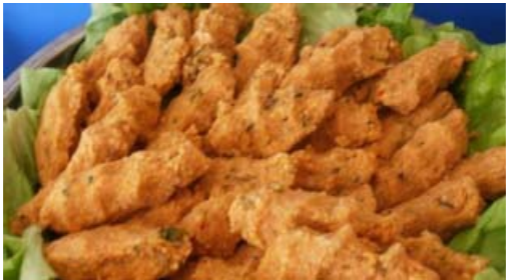
Rote Linsen Röllchen - Mercimekli Köfte