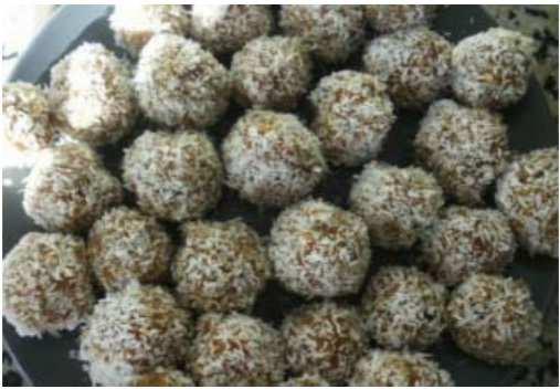
Möhren-Zimt Kugeln - Havuçlu Bonbon