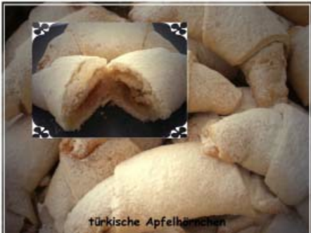
Türkische Apfelhörnchen - Elmalı kurabiyesi