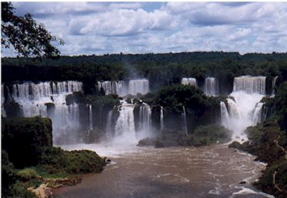
Die Wasserfälle Iguazu an der Grenze zu Argentinien.