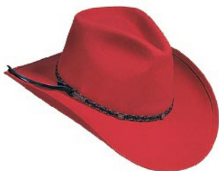
Model: Arizona 2 rot