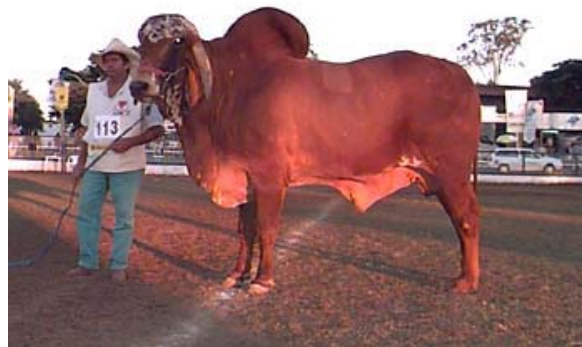
Ein „Gir“ – Rind mit Cupim