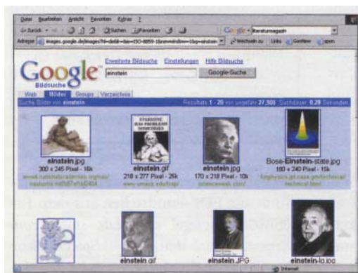
Die Bildersuche bringt schnell passende Resultate

Die Google-Toolbar erweitert Ihren MS Internet Explorer (leider nur den) um ein eigenes Suchfenster. Sie installieren das Plug-in auf http://toolbar.google.com/intl/de direkt aus dem Web heraus. Im Suchfeld können Sie zu jedem beliebigen Zeitpunkt Begriffe suchen, zugleich ist es ein Listenfeld mit einer Liste Ihrer bisherigen